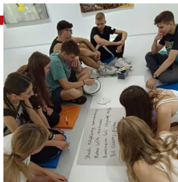
Warsztaty w Bałtyckiej Galerii Sztuki Współczesnej