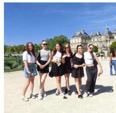
Wycieczka do Paryża