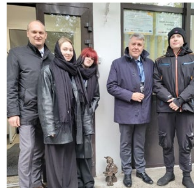
Zjazd Klubu Herbertowskich Szkół